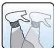
Zakręć i delikatnie potrząśnij do momentu rozpuszczenia saszetki