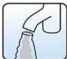
Napełnij butelkę wodą w ilości 750ml