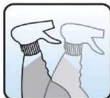
Replace trigger and shake gently to dissolve sachet