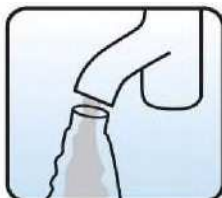
Fill bottle with water to 750ml level